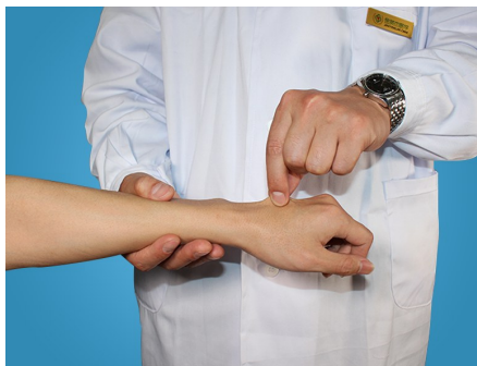
手背皮肤弹性检查

皮肤弹性良好时在手捏过后很快恢复常态,弹性减退时皱褶持久不消。见于慢性消耗性疾病或严重脱水患者。