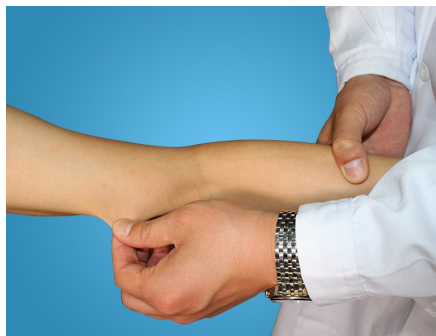
前臂皮肤弹性检查